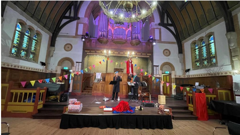
"Pakjespiet is kierewiet!" op 27 november 2022 in de Van Houtenkerk

Zondag 28 mei 2023: 11u Van Houtenkerk / 15u Seinwezen Zondag 4 juni 2023: 11u Het Zonnehuis