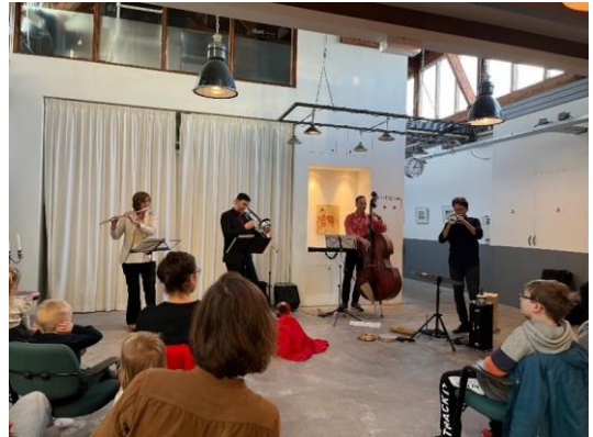
“Vlieg mee naar de maan” in het Seinwezen op 5 februari 2023

De Van Houtenkerk, het Zonnehuis en Het Seinwezen zijn eigendom van Stichting Stadsherstel. De bijzondere locaties versterken de belevenis voor de jongste toeschouwers: niet alleen mogen de kinderen actief meedoen met de muziek, maar dit gebeurt ook nog eens in niet-alledaagse ruimtes, waar veel nieuws te ontdekken valt.