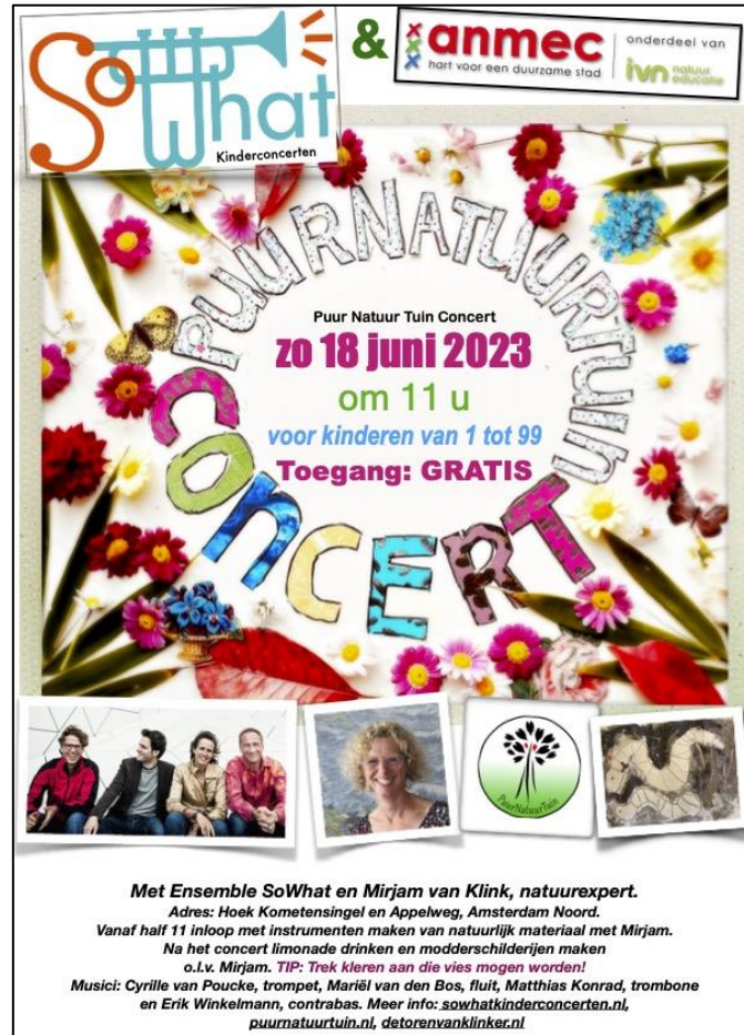
Poster van het PuurNatuurTuin concert