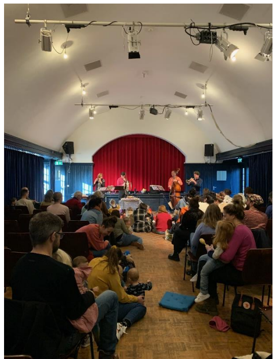
“Van oerknal tot slotakkoord” in de blauwe zaal van het Zonnehuis op 6 januari 2023