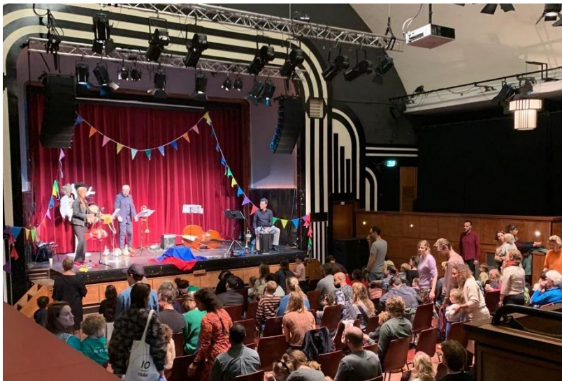
"Koning Trolledrol slaat op hol" op 30 oktober 2022 in de grote zaal van het Zonnehuis

Net als in voorgaande seizoenen hebben wij (jonge) kinderen kennis laten maken met 'volwassen' muziek, in verschillende genres. Kinderen mochten allemaal actief meedoen, luisteren naar hoorspelen, bewegen op muziek, meeswingen, zingen en genieten.